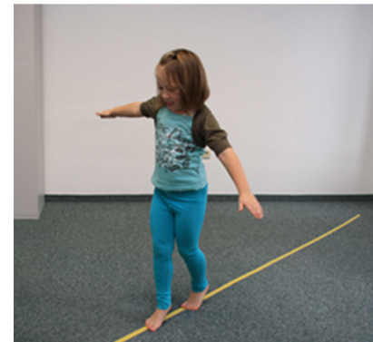
Laufen mit angehobenen Fersen