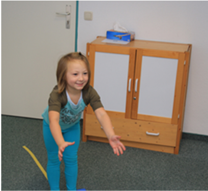
10x Bohnensäckchen fangen