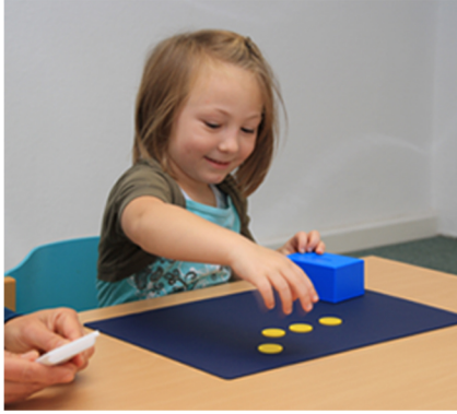
Taler einwerfen - zuerst mit der dominanten Hand