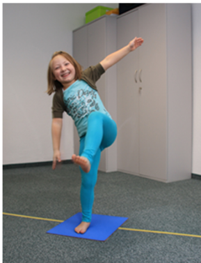
Einbeinstand rechts und links